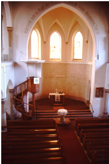
Vor der Innenrenovierung 1982

Unsere Kirche wurde in den Jahren 1847 – 1849 erbaut. Grundsteinlegung war am 23.09.1847, die Urkunde dazu betont, dass die Kirche nach „ganz neuer Bauart“ entworfen wurde.